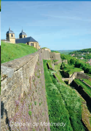
Citadelle de Montmédy

Tout d'abord, une découverte du patrimoine de Stenay avec ses maisons bourgeoises, son kiosque à musique... Stenay, porte d'entrée au Nord du département est une charmante bourgade de la Vallée de la Meuse. La balade vous emmènera à la découverte des lieux et bâtiments les plus emblématiques de Stenay.