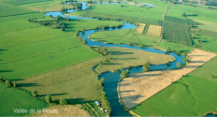
Vallée de la Meuse