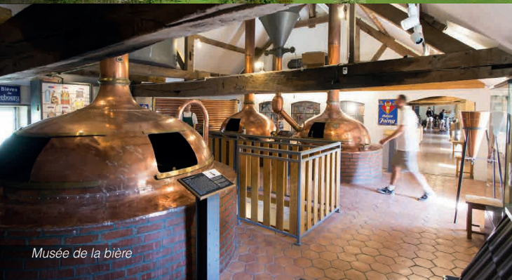
Musée de la bière