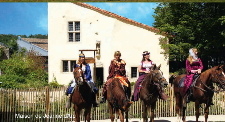
Maison de Jeanne d'Arc